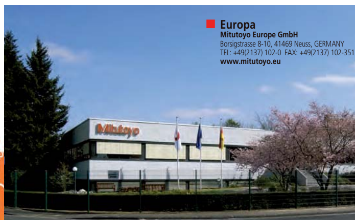
Europa Mitutoyo Europe GmbH Borsigstrasse 8-10, 41469 Neuss, GERMANY TEL: +49(2137) 102-0 FAX: +49(2137) 102-351 www.mitutoyo.eu

Temo-nos vindo a preparar para a expansão do mercado Europeu com bastante antecedência antes que a sua ampliação fosse uma realidade. Como resultado deste plano, dispomos de uma vasta rede de centros de produção, apoio comercial e serviços, presentes em mais de 85 escritórios, com diversos pontos de especialização, disponíveis para os clientes em 33 países Europeus.